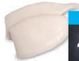
Inktvistubes U5 zak 1 kilo (750 gr netto)