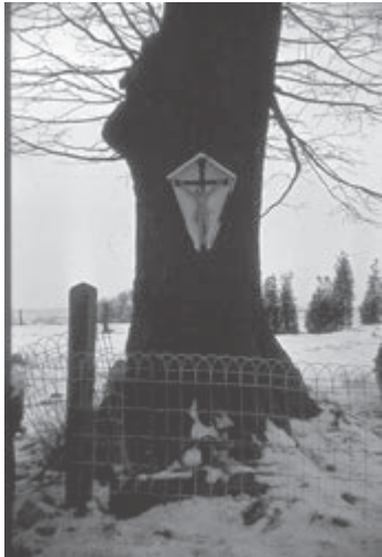
Boomkruis Wissenmicherweg Huls, winter 1976

BOCHOLTZ | Op dinsdag 19 maart a.s. om 20 uur organiseert Heemkundevereniging De Bongard Simplveld-Bocholtz in Café Oud Bocholtz, Pastoor Neujeanstraat 11 te Bocholtz, de lezing Kruisen en kapellen in Limburg .