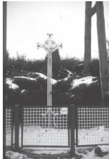
Wegkruis Bouwerweg-Molsbergerstraat Simplveld, winter 1976