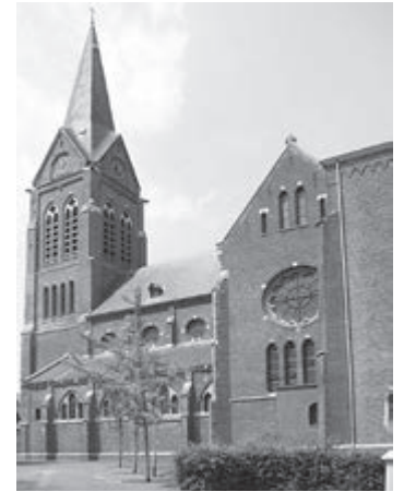
Jacobus de Meerderekerk, Bocholtz

Heemkundevereniging De Bongard Simplveld-Bocholtz