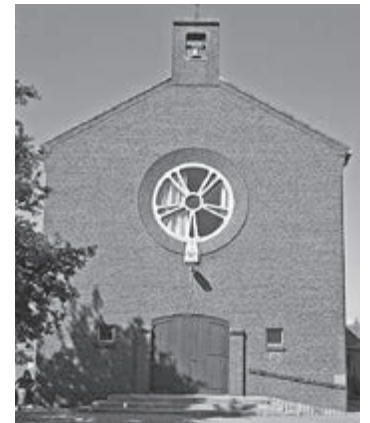
Voormalige Jozef Arbeiderkerk, Huls