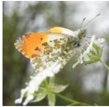
Oranjetipje (mannetje) – Kars Veling

De kosten voor de cursus (twee lezingen, twee excursies, een zoekkaart en een opfrisbijeenkomst op 6 juni) zijn € 7,50 voor IVN-leden en € 10,- voor niet-leden. Aanmelden voor de cursus is verplicht via onze website: www.ivn.nl/afdeling/eys of via e-mail: secretariaat@ivneyn.nl .