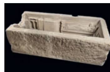
Sarcofaag van Simpelveld

SIMPELVELD - In Heerlen wordt hard gewerkt aan de plannen voor een nieuw Romeins Museum dat het Romeins badhuis, een rijksmonument, ook voor toekomstige generaties zal bewaren. Dat wordt niet alleen gedaan met een beschermend gebouw maar ook door verhalen te vertellen, zodat erfgoed in de harten van de mensen komt. In dat toekomstige Romeins Museum in Heerlen stap je in een tijds capsule. Die landt midden in het leven van de inwoners van Coriovallum (Heerlen) en het lössgebied zo'n 2000 jaar geleden, aan de rand van het Romeinse Rijk. Veel is bewaard gebleven, veel is opgeschreven en zo wordt het leven in de Romeinse tijd tot leven gebracht. Door de ogen van verschillende mensen - een pottenbak-