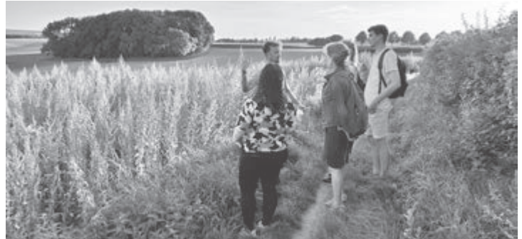
Op 25 november starten Heuvel Angus en Het Limburgs Landschap met landschapsherstel op de Klingeleberg in Simpelveld.

Op zaterdagochtend pas beslissen om te helpen? Dat kan!! Je bent van harte welkom!! 10.00-12.30 en 13.00-16.00 uur. Hoek Schanternelsweg-Loevemicherweg (Huls)