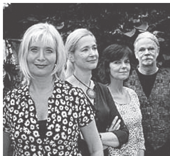
lied van ontroerende eenvoud. De drie dames en één heer

WITTEM - Op vrijdag 10 november verzorgt Flor de Amor een avondvullend concert in de Kloosterbibliotheek Wittem. Wat u mag verwachten op deze avond van dit ensemble dat al jaren met veel succes aan de weg timmert? Welnu: om te beginnen een mooie afwisseling van tango's, bolero's, Spaanstalige liederen en uiteraard spontane improvisaties. Vaak temperamentvol, soms opzweepend, gevolgd door een