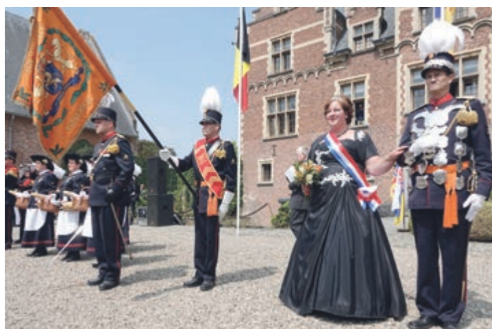
Impressie van het bondsfeest RKZLSB in Mheer (2023). Foto's: Lieske Leunissen.

den, reglementen en beoordelingen. Momenteel maken er vijftien actieve schutterijen deel van uit, afkomstig uit de dorpen Vaals, Vijlen, Simpelveld, Ubachsberg, Voerendaal, Eys, Mechelen, Epen, Wijlre, Strucht, Valkenburg, Houthem, Margraten, Sint-Geertruid en Mheer.