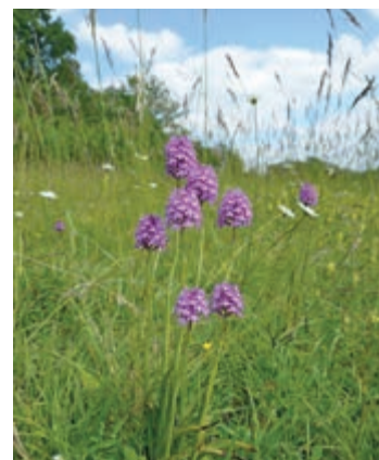
Hondskruid, één van de orchideeënsoorten die verwacht worden aan het Hoge Bergpad.

Vanaf eind augustus tot medio oktober wordt de bovengrond afgegraven en afgevoerd. Hierbij worden ook de stobben en de oppervlakkig gegroeide wortels van de fijnsparren verwijderd. Ter compensatie van dit verloren gegane bos is afgelopen winterperiode bij groeve 't Rooth bij Bemelen al een stuk gemengd loofbos aangeplant. Tijdens de werkzaamheden is het Hoge Bergpad afgesloten. Op de Kromhagerweg zal door de afvoer van vrijkomend ma-