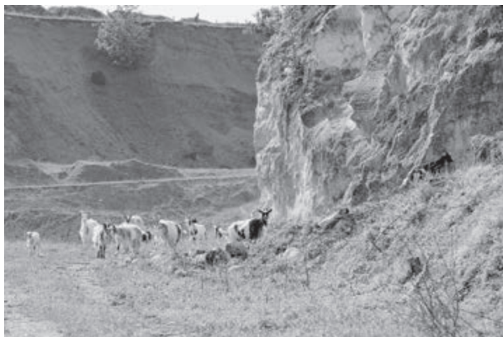
Kom de Curfsgroeve ontdekken tijdens een excursie van Het Limburgs Landschap op 27 augustus of 2 september.

Een deel van de Curfsgroefve is, vanwege het gevaar voor vallende stenen, maar ook door de aanwezigheid van bijzondere natuurwaarden, afgesloten voor het publiek. In dat deel zijn geen wandelpaden aanwezig, goede wandelschoenen zijn daarom verplicht en een wandelstok kan handig zijn om de balans te bewaren. Deze wandeling is niet geschikt voor mensen die slecht ter been zijn en honden zijn bij deze excursie