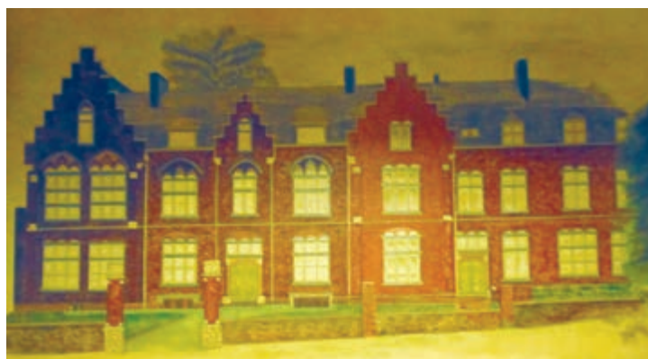
Zusterklooster Bocholtz tekening Harrie Bloemen