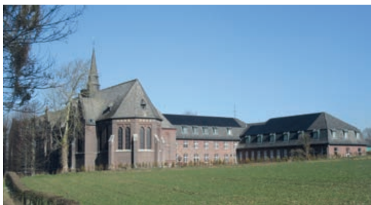
Paterklooster Damiaan Simpelveld

Heemkundevereniging De Bongard Simpelveld-Bocholtz