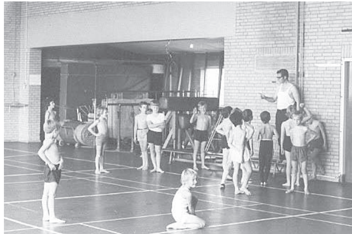
Gymles St. Aloysius school 1971

de jaren die hij als voorzitter het gezicht van onze vereniging was. Start van de vergadering is 19.30 uur.