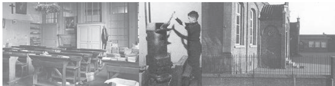
Een kijkje in de 4e klas.