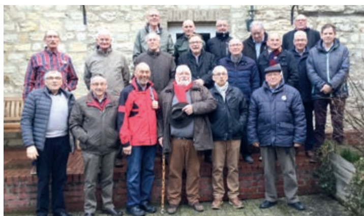
Een aantal Klasgenoten uit 1954 in 2018.