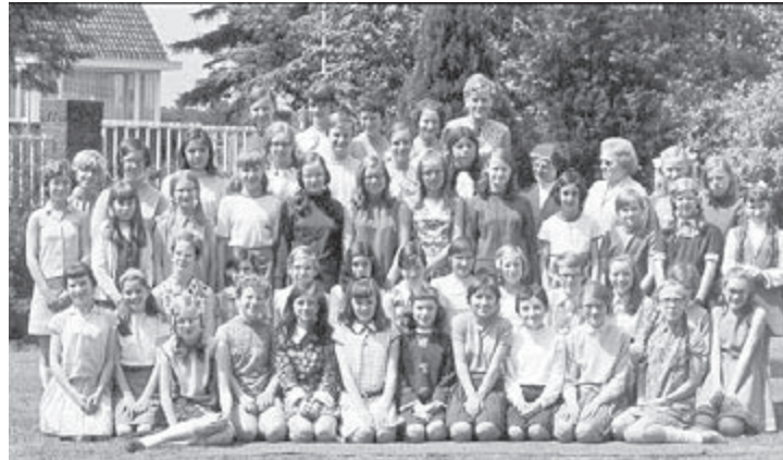
Schoolverlaters St. Vincentius school 1969