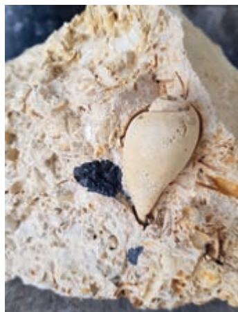
Kunrader kalksteen, typische combinatie van marien (gastropoden, bivalven, koralen) en terrestrisch materiaal (steenkool)

De Kunrader kalk is in een periode van zo'n 67 tot 66 miljoen geleden afgezet in zee. Dat gebeurde gelijktijdig met een groot deel van de Kalksteen van Lanaye (Formatie van Gulpen) tot en met de Kalksteen van Emael (Formatie