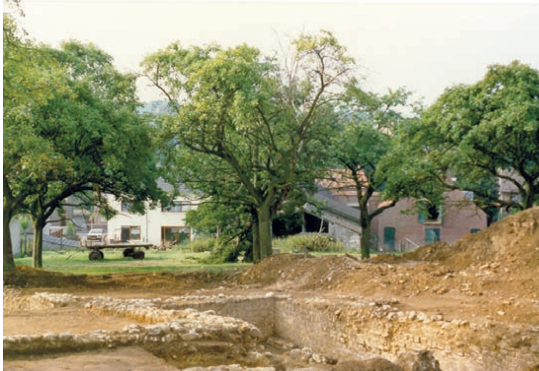
Opraving Villa de Molt Simpelveld 1989

Als we nu door de dorpen Simpelveld en Bocholtz wandelen, kunnen we ons moeilijk voorstellen dat onder de grond nog een hele geschiedenis verborgen is. Terwijl de gemeente Simpelveld tot een van de regio's met de oudst bekende bewoning in Nederland behoort. De Bandkeramiekers kenden onze regio, ze hadden een kleine nederzetting en gebruikten de grondstoffen die onze gemeente rijk is. Vervolgens kwamen de Romeinen naar deze contrèien. Ook zij lieten sporen achter, deze sporen behoren tot de grootste schatten van