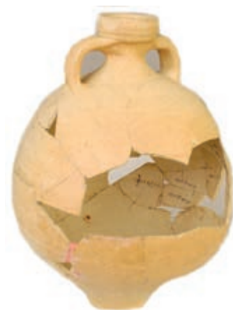
Aardewerk amfoor vindplaats De Molt Simpelveld 1989 – Foto Rob Scholl

Meld je snel aan voor deze module om meer van de geschiedenis van Bocholtz, Simpelveld en de directe omgeving te leren kennen!