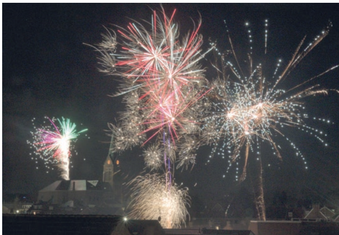
Vuurwerk tijdens jaarwisseling 2022/2023 in Bocholtz rondom de kerk.

We starten het nieuwe jaar met onze jaarvergadering op 18 januari om 19.00 uur. Aansluitend is er een film over Simplveld. Na een periode van 2 jaar wegens Corona, is er weer een nieuwe reeks lezingen: PSC voor vrouwen in het Heuvelland. Het bericht hierover staat in de Troebadoer van week 1 (vorige week). Aanmelden en betalen bij Lea Lennartz, tel.06-11057597 graag z.s.m. want vol is vol.