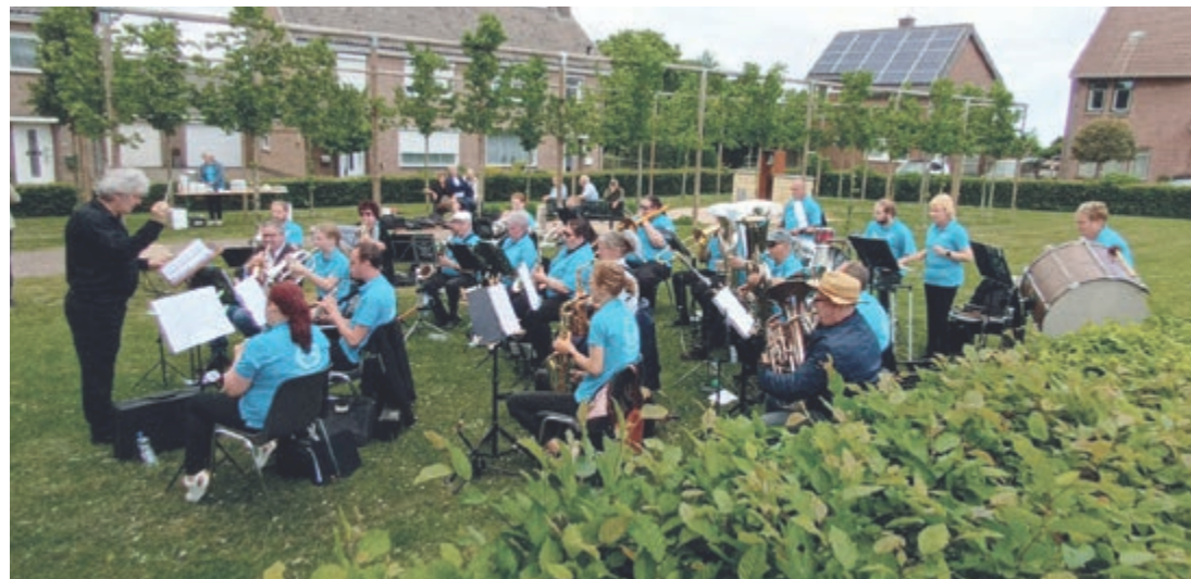
Buitenrepetitie d.d. 26 mei 2022 Fanfare Eendracht Huls Simpelveld

worden opgevoerd door het orkest. Tussendoor wordt een korte uitleg gegeven van iedere instrumentengroep, zowel in woord en als klank. Binnen de orkest opstelling worden enkele plekken vrijgehouden zodat diegene die wil, kan ervaren hoe het is in het orkest. Daarnaast zullen er ook verschillende oefeninstrumenten zijn voor wie durft!