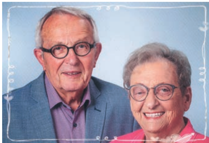
Scheelenstraat 127 - 6369 VT Simpelveld