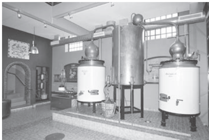
Impressie Elsmuseum (met dan aan Elsmuseum)

SIMPELVELD - Met gepaste trots presenteert de nieuwe werkgroep "Samen op Stap" voor senioren (55+) op woensdag 21 september een begeleide dagtocht naar het mooie Rijnstadje "Königswinter" voor een eenmalige promotieprijs van € 15,- per persoon. De trip is hoogst attractief voor gebruikers van een rollator. Ook 55-plussers vanuit de regio kunnen zich aanmelden. Diverse opstapplaatsen in de kernen Simpelveld en Bocholtz maakt deelname zeer comfortabel. Om te voldoen aan de grote belangstelling voor deze dagtocht