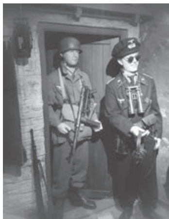
Impressie Eyewitness museum (met dank aan Eyewitness)

Met een gedurfd en eigentijds concept is de bezoeker van Oorlogsmuseum Eyewitness ooggetuige van de Europese geschiedenis van de Tweede Wereldoorlog. In 13 diorama's worden met 150 levensgrote mannequins en originele attributen verschillende oorlogsscènes uitgebeeld. De Duitse pa-