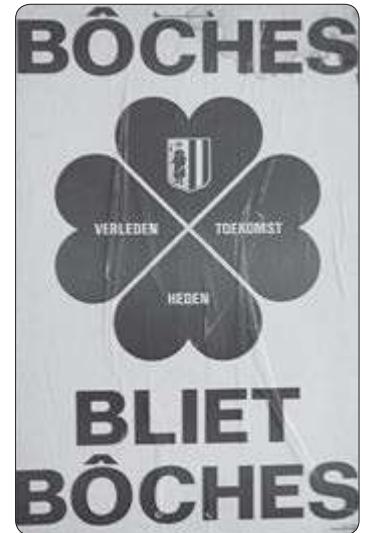
Logo Bôches bliet Bôches