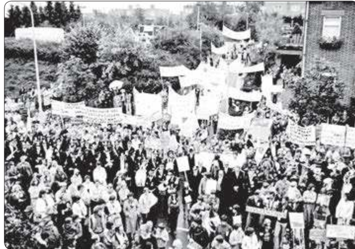
Demonstratie Bôches bliet Bôches 13-10-1979