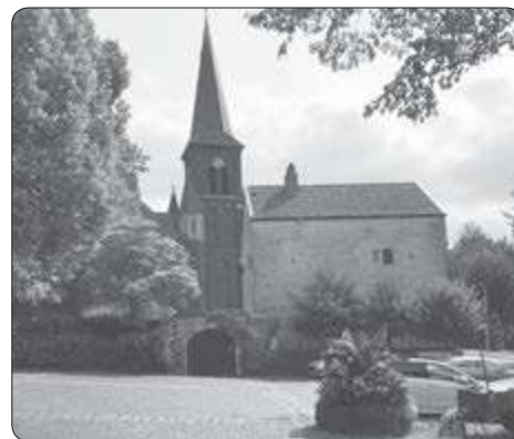
Kerk en Burg Orsbach

ORSBACH (D) - Onder leiding van Dietmar Kottmann zullen wij op zaterdag 8 september een wandeling maken door ons buurdorp aan de andere kant van de grens, Orsbach. Om 13:15 uur verzamelen wij bij de Burg Orsbach. Deze ligt midden in het dorp op het adres: Düserhofstrasse 60 te Orsbach.