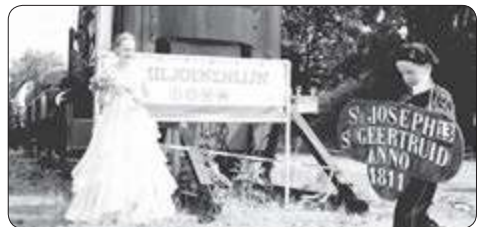
Afgelopen weekend vond in Simpelveld het 250e bondschuttersfeest plaats op het prachtige evenemententerrein van de ZL-SM.