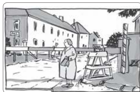
Tekening: Toon Hezemans