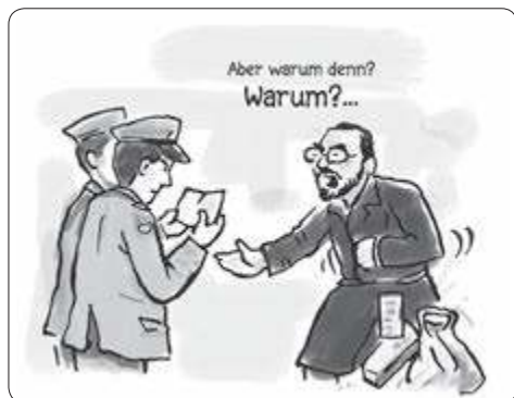
Tekening: Gady Mirtenbaum

wil zeggen in de vorm van prikkeldraad, wachttorens, slagbomen, hekken en de reeds langer aanwezige grenspalen die sedert de Franse Tijd de oude grensteken vervingen. Nadien is de grens in zijn fysieke vorm slechts her en der als monument aanwezig: gerestaurerde douanehuisjes, een opgetuigde slagboom of een vergeten