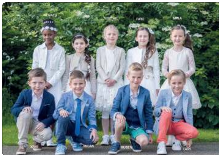
De communicantjes van de St. Martinus parochie Vijlen willen graag iedereen heel erg bedanken die op welke wijze dan ook, heeft bijgedragen aan een bijzonder mooie, onvergetelijke communiedag! 20 mei 2018

Sinds zijn eerste verschijning van het boek "De adelaars" (1993) heeft Kader Abdolah een grote reeks boeken uitgebracht. Zijn laatste verschenen boek Salam Europa!, is een boek over nieuwsgierigheid en belangstelling voor de ander.