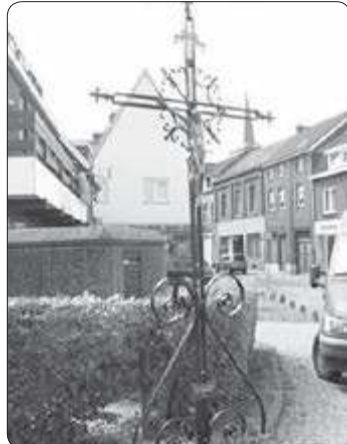
Kruis aan de rotonde in Simpelveld

SIMPELVELD - Op Goede-Vrijdag 30 maart 2018 houdt de heemkundevereniging de Bongard de 23e Meditatieve Wegkruiswandering langs 14 wegkruisen in Simpelveld. Deze keer volgen wij een route langs 14 wegkruisen in Simpelveld. Bij elk kruis wordt even gepauzeerd en krijgt de wandelaar een thema aangereikt ter overdenking op weg naar het volgende kruis. De wandeling gaat onder alle weersomstandigheden door. Het is dus raadzaam om voor aangepaste kleding en schoeisel te zorgen. Deelname aan de wandeling is geheel voor