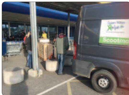
Een van de vele karren met spullen bij IKEA Heerlen