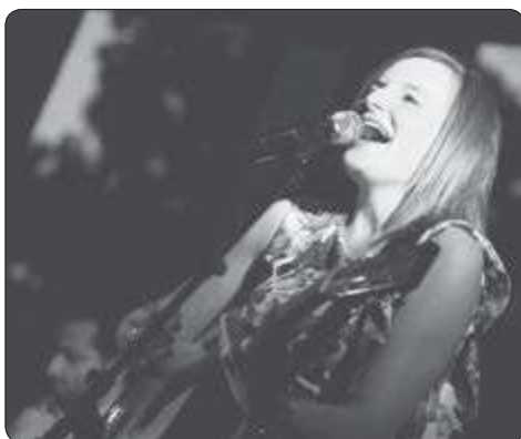
Zangeres en presentatrice Dyanne Sleijnen

Info: www.fanfareubachsberg.nl of Facebook.