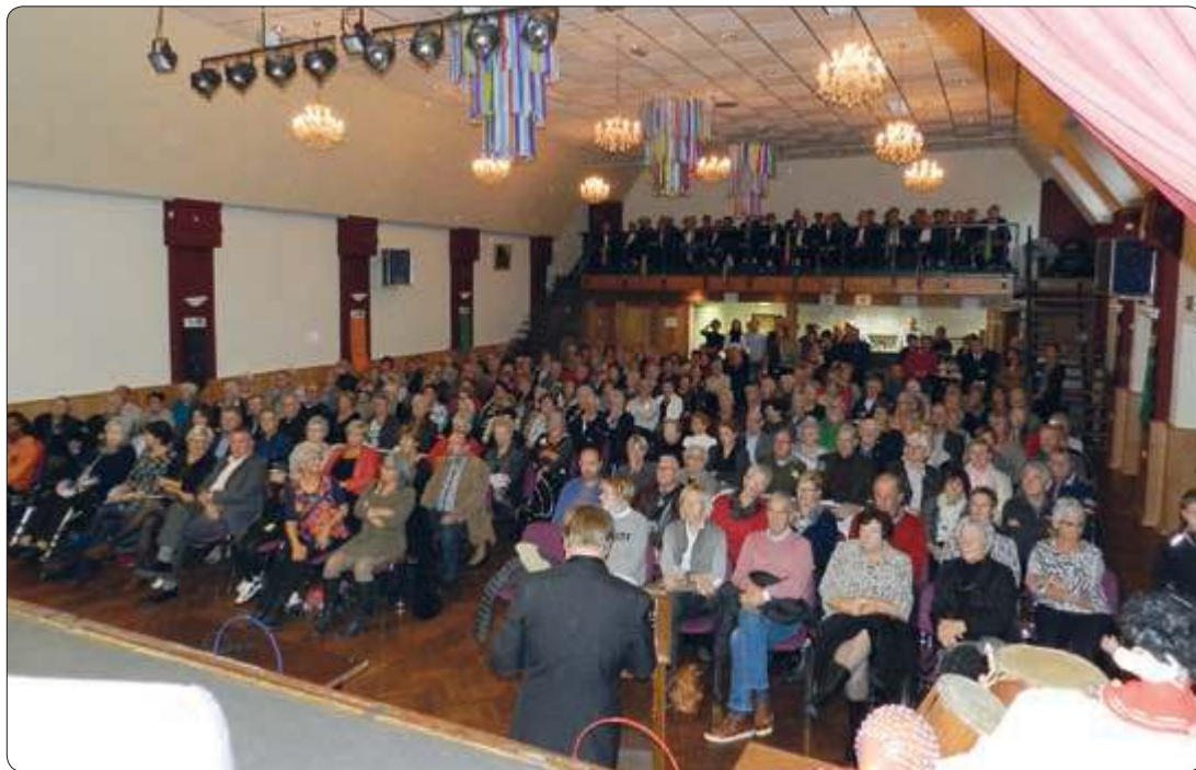
Wij verwachten een uitverkochte 'Rocktempel'

Samen met fanfare St. Cecilea Bocholtz, koor 'New Generation' uit Merkelbeek, saxofoon-ensemble 'Les saxes de Cécile', combo 'Leon and his Friends' en enkele 'rock' dansparen, zal Zangkoor St. Joseph uit Bocholtz, via een specifiek repertoire een hulde brengen aan rocklegende Elvis Presley die precies 40 jaren geleden, is overleden. "Classic meets Rock 'n Roll" is dan ook de naam die gekozen is voor dit unieke project. Sinds begin oktober repeteren heel wat enthousiaste gastzangers en -zangeressen met het koor mee en kijken uit naar de apotheose van dit spektakel-