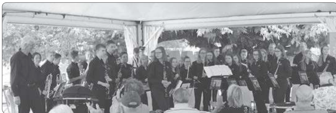
Op zondag 9 juli was de drumband en de jeugdharmonie van de Koninklijke Philharmonie Bocholtz uitgenodigd om een concert te geven op het WMC in het park in Kerkrade.