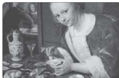
Jan Steen "meisje dat oester (en misschien ook wel zichzelf) aanbiedt". (detail) Arjen van Prooyen.

de wellustige oriëntaalse dame wordt later verder uitgewerkt door de oriëntalist en de salonschilders van de 19de eeuw. In de twintigste eeuw bekijken we op welke wijze popartkunstenaars aankeken tegen de massacultuur, de verleidingen van de reclamewereld en de verbeelding van het vrouwelijke naakt. Maar er is een keerzijde. Het verhaal krijgt een wending als we de schilderkunst beschouwen vanuit de artistieke ogen van de moderne vrouw in de hedendaagse kunst. Het is het antwoord van de verbeelding op de zogenaamde "male gaze". Laat u verrassen door een erotiserend en spannend verhaal dat nergens vulgair wordt en aanzet tot nadenken. Aanmelden via: 043-3080110 of vaals@heuvellandbibliotheek.nl