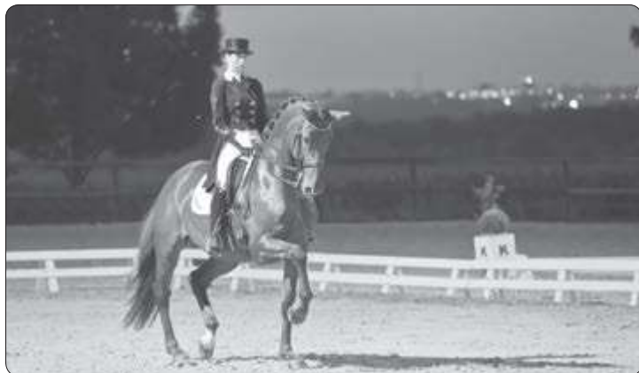
Dressuurwedstrijd in Bocholtz

Toegang is alle dagen gratis, u bent van harte welkom om een kijkje te komen nemen.