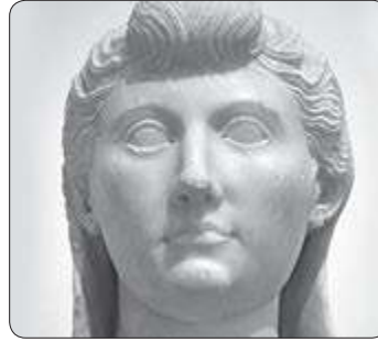
Buste van Livia, de vrouw van Keizer Augustus, het toonbeeld van de machtige, zelfbewuste vrouw uit de Romeinse tijd.

Partij, hetgeen natuurlijk op veel bezwaren stuit. De voorzitter van de stichting geeft in de brief aan, dat dit volledig indruist tegen de doelstelling die hun nastreven, door het behoud van de nog aanwezige voorzieningen en uitbreiding waar mogelijk, de leefbaarheid in Wahlwiller voor alle inwoners te bevorderen en in stand te houden en daar hoort ook een brievenbus bij. Een afschrift van de brief hebben ze ook naar het College van Burgemeester en Wethouders gestuurd, die via een sms-berichtje meteen hun steun toezegden. Ook Transportbedrijf Van der