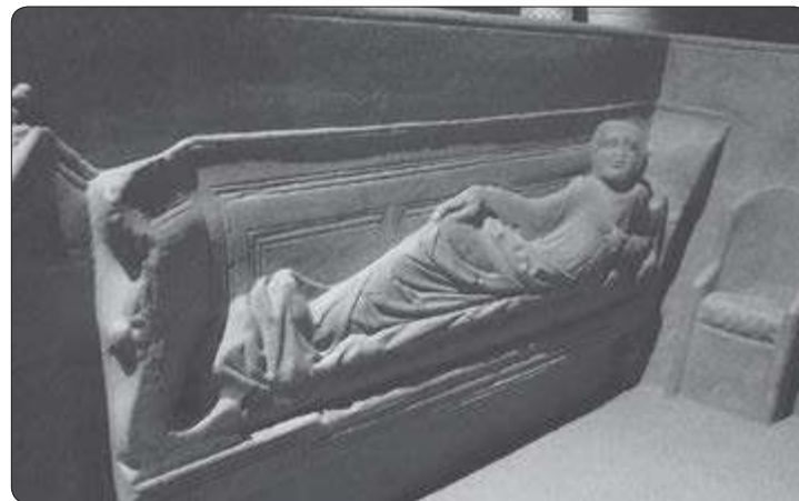
Detail sarcofaag van Simpelveld met 'Dame van Simpelveld'