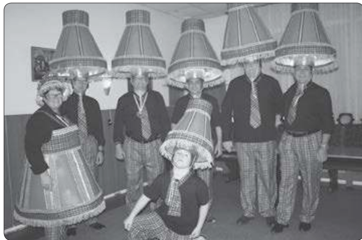
Durpsjonge winnende schlager 2017. Op zaterdag 12 november j.l. hebben de Durpsjonge voor de derde keer (en voor de tweede maal op rij) de Schlagerzietsong gewonnen! Dit keer met het nummer "Ging prinsekap, mer ing lampekop." Namens alle Woeësj-joepe van harte gefeliciteerd en een fantastisch carnavalsseizoen toegewenst!

vriestkasten. Blijkt tijdens de reparatie dat het niet meer lonend is om uw apparaat te repareren, kunnen wij u wel een nieuw apparaat bezorgen/inbouwen. Verder zal de service, tijdens de garantieperiode, aan de bij ons gekochte apparaten blijven doorlopen. Voor de verkoop van installatiematerialen, lampen etc. kunt u terecht in ons magazijn aan de Rijksweg 66. Begin december starten we me de uitverkoop van de winkelrestanten maar u kunt natuurlijk tot het eind van het jaar terecht voor alle nieuwe apparatuur. Wij hopen op uw begrip en bedanken alle klanten en relaties.