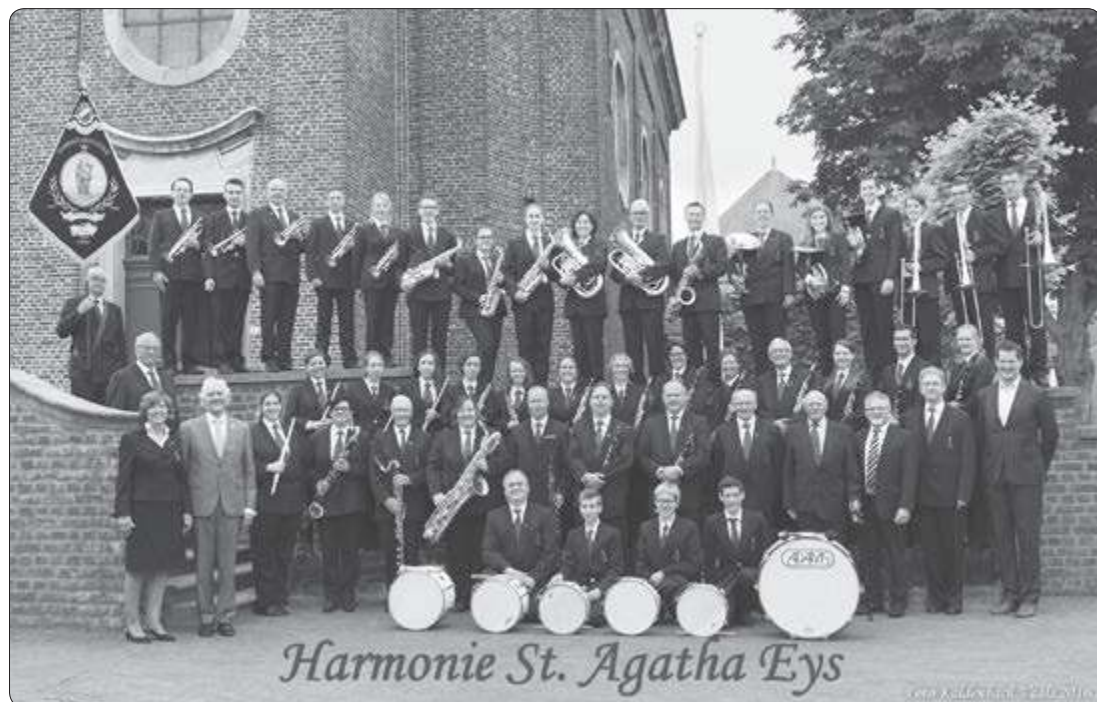
Harmonie St. Agatha Eys