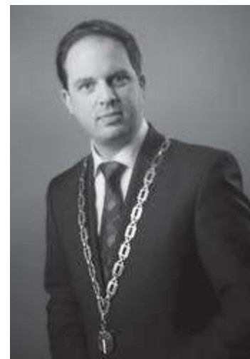
Burgemeester Richard de Boer Portefeuillehouder openbare orde en veiligheid

De krant is ook bedoeld om u enthousiast te maken om zelf aan de slag te gaan. In de komende maanden verschijnt er nog een aantal edities van de Veiligheidskrant over de brandweer, sociale veiligheid en veiligheid in het verkeer. In de laatste editie vertellen we u meer over de specifieke rol van de gemeente.