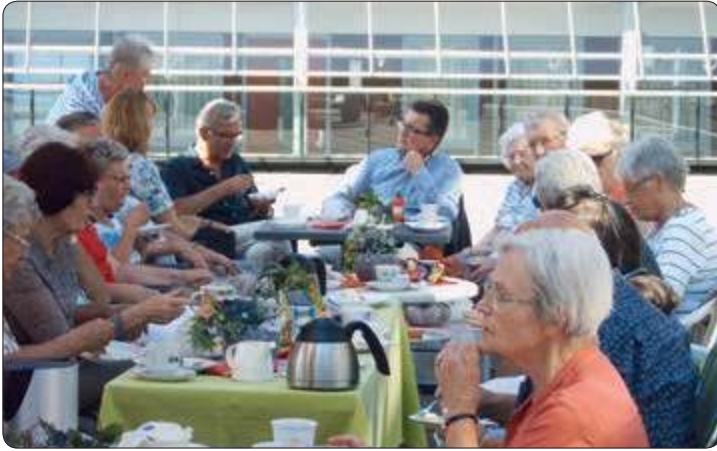
De opening: 'n fraai en groot dakterras, waar de bewoners met of zonder parasol genieten van hun koffie/thee en soms vla en vooral van de mooie bloemen. Samen sponsoren... Samen verzorgen... Samen genieten... Wie sjun kinste 't maache.