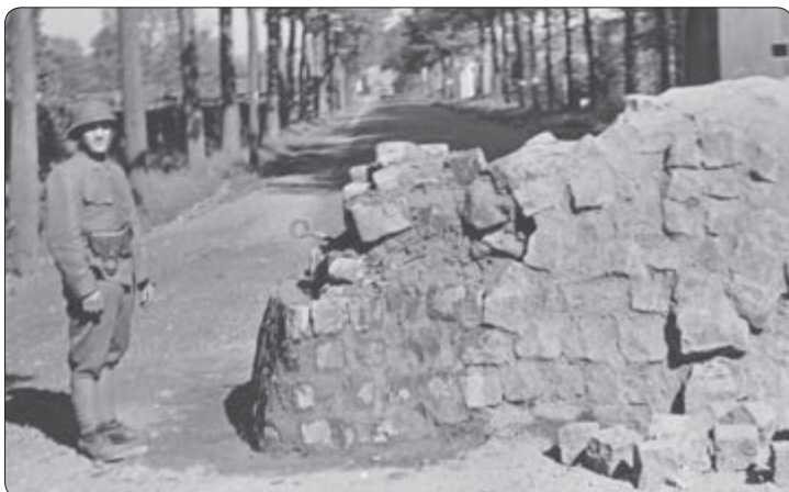
Op de foto staat luitenant Houtappel bij de barricade in Nijswiller. Hij zou tijdens de oorlog vanwege zijn verzetswerk in een Duits concentratiekamp sterven.