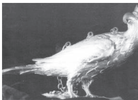
De koningsvogel, een gekroonde adelaar, zittend op een tak.

Jaarlijks schiet de schutterij op de houten koningsvogel. Degene die het laatste restje van de vogel van de paal schiet, wordt de nieuwe schutterskoning. Deze geeft een zilveren plaat aan de vereniging, waarop zijn naam en het jaartal van zijn koningschap vermeld staan. De oudste koningsplaat dateert uit 1634. De nieuwe koning krijgt de zilveren koningsvogel en het zilver van zijn voorgangers omgehangen en hieraan is herkenbaar wie de schutterskoning van dit jaar is. Deze zilveren koningsvogel is een fraai staaltje zilversmeedkunst en is tevens het oudste levensteken van de Simpelveldse schutterij. Onder een vleugel staat in een minuscule gravure het jaartal 1442 gegraveerd.