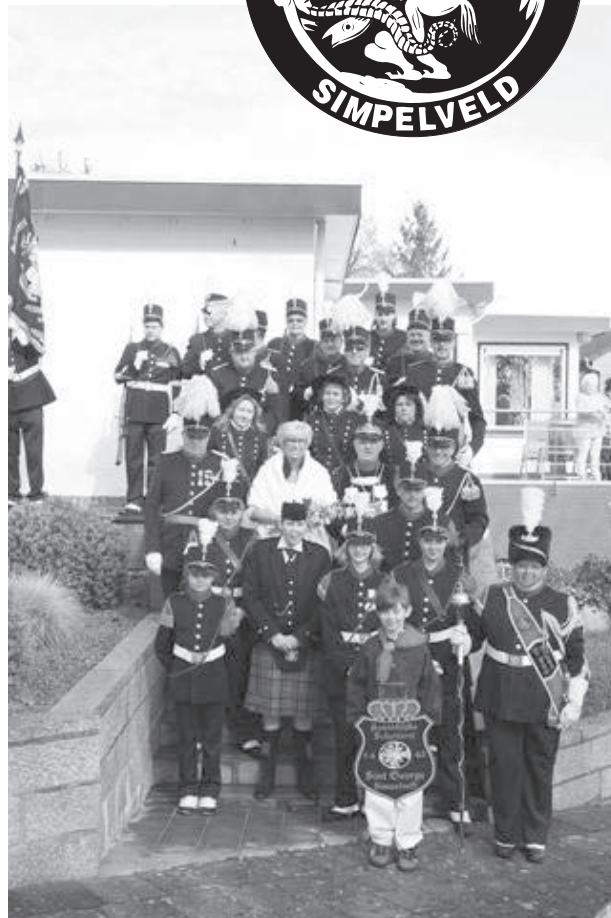
Schutterij St. George, april 2015