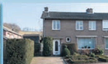
Gulpen Tramweg 1 Vraagprijs € 185.000,- k.k.