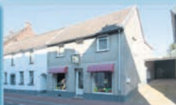
Wijlre Marchierstraat 28 Vraagprijs € 185.000,- k.k.