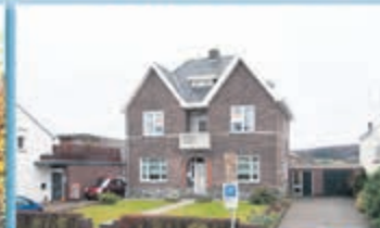
Epen Wilhelminastraat 17 Vraagprijs € 275.000,- k.k.