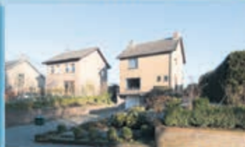
Reijmerstok Haagstraat 21 Vraagprijs € 255.000,- k.k.