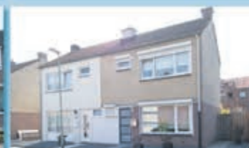
Bocholtz Beatrixstraat 39 Vraagprijs € 185.000,- k.k.