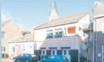
Bocholtz Dr. Nolensstraat 12 A Vraagprijs € 135.000,- k.k.