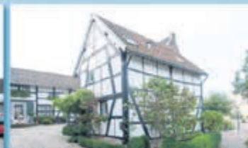
Mechelen Hilleslagerweg 6 A Vraagprijs € 225.000,- k.k.