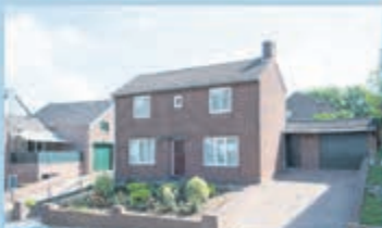
Mechelen Commandeurstraat 29 Vraagprijs € 225.000,- k.k.