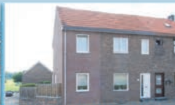
Wijlre Jan van Houtemstraat 6 Vraagprijs € 169.950,- k.k.