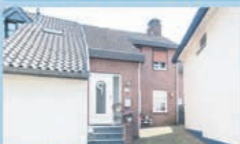
Wittem Vossenstraat 22 Vraagprijs € 195.000,- k.k.