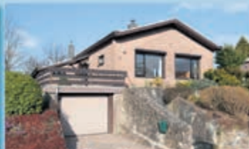
Scheulder Scheulderdorpsstraat 57 Vraagprijs € 235.000,- k.k.