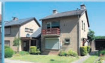
Eys Hoebigerweg 51 Vraagprijs € 179.000,- k.k.