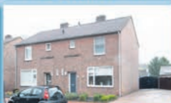
Wittem Oude Baan 33 Vraagprijs € 195.000,- k.k.