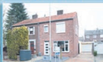
Eys Pastoor Duckwellerweg 14 Vraagprijs € 199.000,- k.k.