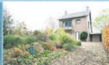
Reijmerstok Haagstraat 17 Vraagprijs € 265.000,- k.k.