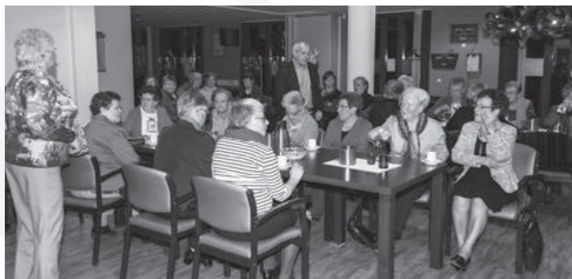
Een gezellige avond bij ZijActief Simpelveld