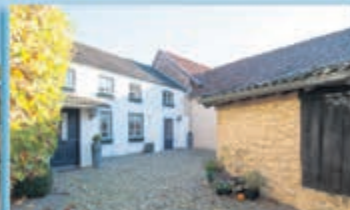
Elkenrade Elkenrade 13 Vraagprijs € 235.000,- k.k.