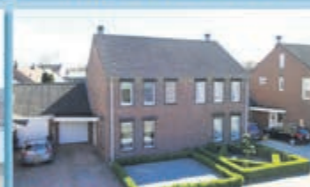
Bocholtz Dautzenbergstraat 6 Vraagprijs € 199.000,- k.k.