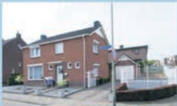
Bocholtz Emmastraat 18 Vraagprijs € 245.000,- k.k.