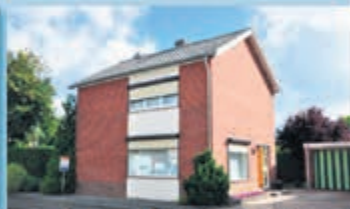
Bocholtz Beatrixstraat 36 Vraagprijs € 217.000,- k.k.