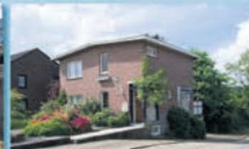
Wijlre Scheyffart van Merodelaan 16 Vraagprijs € 242.500,- k.k.