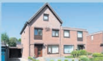
Wijlre Van Binsfeldstraat 2 Vraagprijs € 179.000,- k.k.