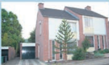
Gulpen Groeneweg 33 Vraagprijs € 208.000,- k.k.