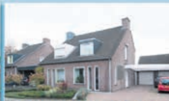
Gulpen Dr. Delissenstraat 5 Vraagprijs € 225.000,- k.k.