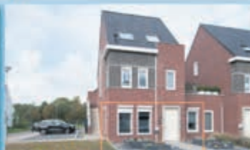
Voerendaal Tenelenweg 176 Vraagprijs € 147.000,- k.k.