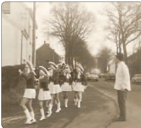
Eerste optocht in Nijswiller, 1968.