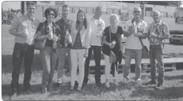
Winnaars: Team 14 (Boessen Tegelzetbedrijf en Paardenstalling Wiertz)

Op donderdag 29 mei, Hemelvaartsdag, vond het koningsvogelschieten plaats van schutterij St. Joseph Vijlen. Als organisatie van het ZLF 2014 waren wij natuurlijk zeer benieuwd wie het