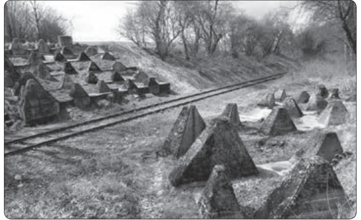
De 'drakentanden', het restant van de Siegfriedlinie, die op het spoortraject naar Vetschau nog zijn te zien.