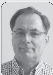
Ger Seroo Markt 7e Simpelveld Lijst 3 - nr. 5