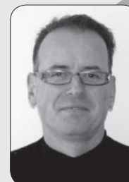
Maurice Hollanders Norbertijnenstraat 10 Simpelveld Lijst 3 - nr. 9